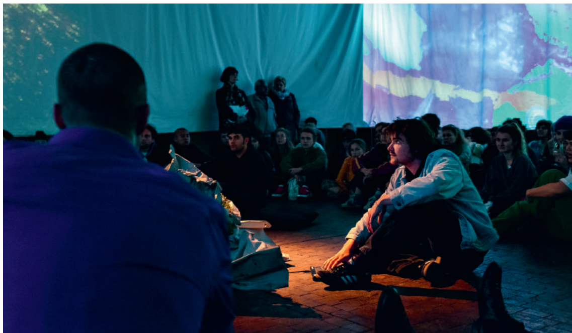
Eingebettet in die 360°-Projektionen lauschten und schauten die zahlreichen Zuschauerinnen und Zuschauer gespannt die verschiedenen Performances der La Polimage 2 im Humbug.

Im Berichtsjahr 2019 konnten besonders viele Menschen von den Beiträgen des GGG Kulturkicks profitieren. Neben der neuen Rekordzahl von 97 Eingaben lässt sich im Jahr 2019 ein grosser finanzieller Zuspruch für Plattformprojekte aus diversen Sparten vermerken. Mit der Unterstützung solcher Projekte werden zum einen die Initiantinnen und Initianten gefördert, indem sie organisatorische und teilweise kuratorische Erfahrungen sammeln können. Zum anderen werden aber auch die an den Projekten beteiligten Kunst- und Kulturschaffenden unterstützt, welche dank solcher Plattformen ihre Beiträge einer breiten Öffentlichkeit zeigen können. Das Erfreuliche an solchen Projekten ist, dass sich junge Menschen selbst eine Plattform schaffen und somit eigene Ausdrucksformen finden und Lücken schliessen, die sie selbst identifizieren.