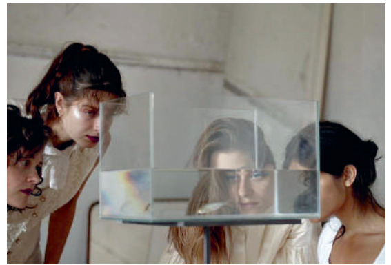
Standbild aus den Aufnahmen des Filmes «To be there», den der GGG Kulturkick, kurz bevor die Regisseurin Teil der Fachgruppe wurde, unterstützt hat.