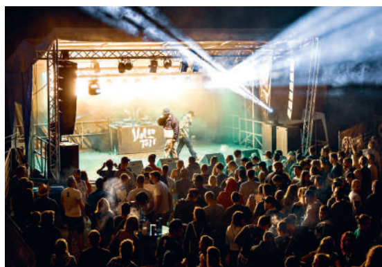
Der AM Jam, organisiert vom Verein Anderst Motiviert, brachte im August rund 500 Hip-Hop-begeisterte Besucherinnen und Besucher ins WB Tal.