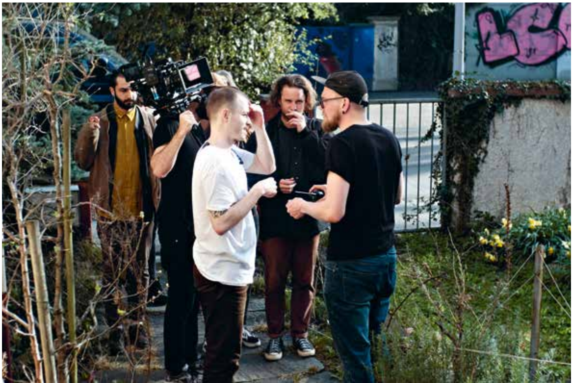
Die Band Yerna und ihr Team beim Dreh des One-Take-Musikvideos

spricht «Hilft öbber?», stellt eine weitere Form der Vernetzungsarbeit, der Projektunterstützung und der Entdeckung von Jugendlichen und ihren Projekten dar, die im digitalen Raum stattfindet.