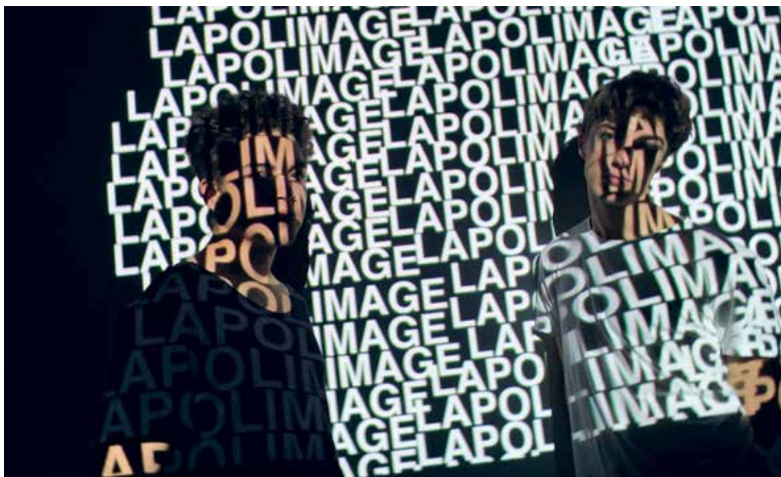
«La Polimage», Multimediainstallation

tor: Wut, Trauer, Liebe» und «Koffein», welche im Safe des Unternehmens Mitte aufgeführt wurden. Zählt man alle Bands hinzu, welche in ihrer jungen Karriere vom GGG Kulturkick für Aufnahmen, EP und Albenproduktionen unterstützt wurden, und die Filmprojekte, welche parallel am Gässli Festival im Rahmen des JKF gespielt werden, waren es 20 geförderte Projekte, die einen Platz am grössten Jugendkulturfestival der Region gefunden haben. Die erfolgreiche Kooperation wird 2019, wenn das Jugendkulturfestival das nächste Mal stattfindet, weitergeführt werden.