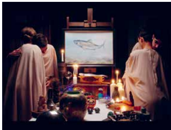
Klappe frei für den Film von Xheni Alushi