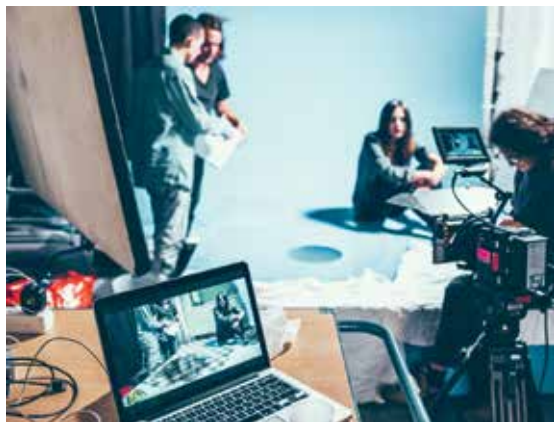
Am Set von «Eva»